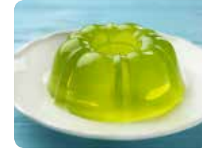
جيلو أخضر أو أصفر