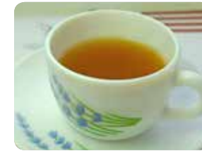
قهوة أو شاي بدون حليب