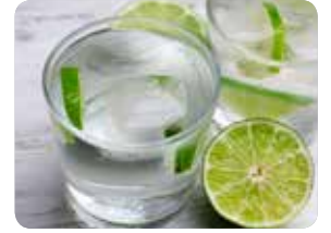
مشروب غازي بالليمون